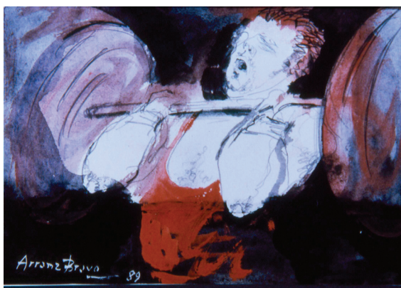
FIGURA 2. Halterofilia