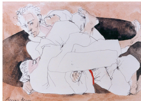
FIGURA 4. Judo