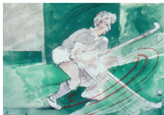
FIGURA 3. Hockey