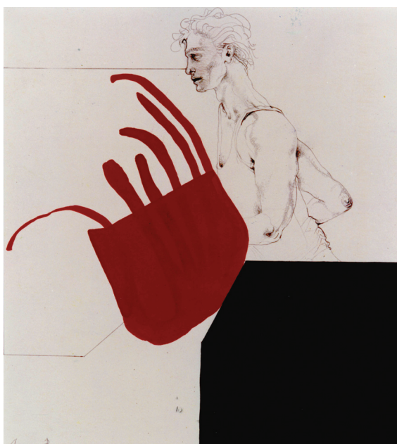
FIGURA 9. Atletismo

ta, el remo o el caballo, elementos esenciales del juego respectivo. En otras obras el dibujo puro, perfecto en su ejecución, constituye la base de la escena; en todas ellas la imagen dibujada se ve reforzada por una irregulares manchas en rojo y negro, que sirven de contrapunto a la situación. Dentro de este grupo se encuentran el béisbol, la esgrima, el fútbol, la gimnasia, el tiro olímpico, el tenis, el atletismo, el tiro con arco, el voleibol, el pentatlón moderno, el piragüismo y el balonmano. La colección la completa un óleo dedicado a la vela.