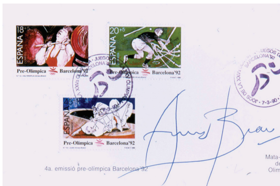
FIGURA 5. Sellos de correos preolímpicos

collage, técnica mixta). De un evidente realismo son las pinturas dedicadas a tenis de mesa, natación, lucha, ciclismo y boxeo. El bádminton, el baloncesto, el remo o la equitación, están representados por el volante, la ces-