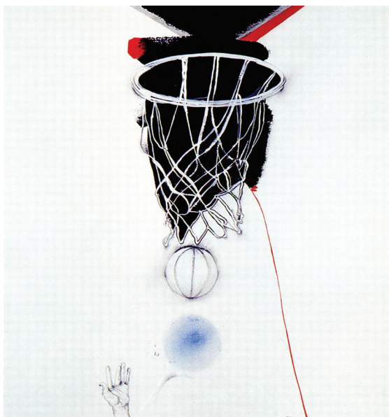
FIGURA 6. Baloncesto