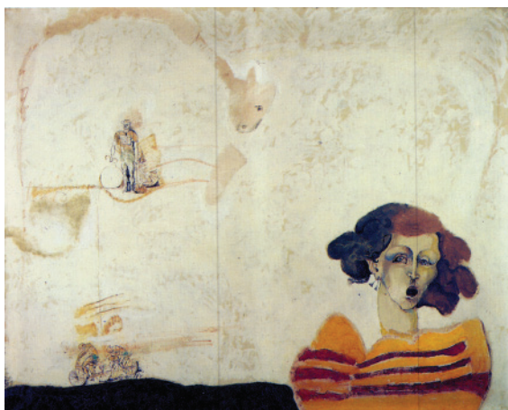
FIGURA 1. Mujer gritando antes de la caída del ciclista

rácter poco progresista del profesorado. Hacia 1967 su pintura cambia radicalmente, entrando en una línea de figuración libre que los críticos han denominado nueva figuración . Su tema fundamental es el cuerpo humano que no pretende en modo alguno reproducir. Analiza los efectos y defectos corporales y, a partir de este análisis, recrea un cosmos que es a la vez inventado y real, imaginativo y verdadero. Se ha dicho que Arranz-Bravo destruye para volver a crear. En estos años se suceden exposiciones, individuales y colectivas, y obtiene el 1er Premio de pintu-