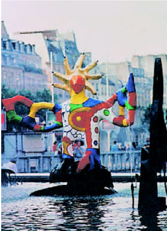
FIGURA 7.- Fuente de Stravinsky. El pájaro de fuego. 1982

Sida, colaborando en un film de dibujos animados realizado por su hijo Philip , basado en un libro original de la propia artista. Titulado, El Sida: tú no me atraparás , ha sido publicado por la Agencia francesa de la lucha contra el Sida y distribuido a todas las escuelas del país.