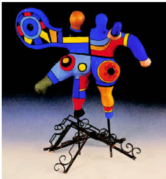
FIGURA.5.- Patinadores, 1975.

paganos, en los cuales se agrupaban objetos contradictorios como revólveres, ratas, dinosaurios e incluso algún crucifijo.