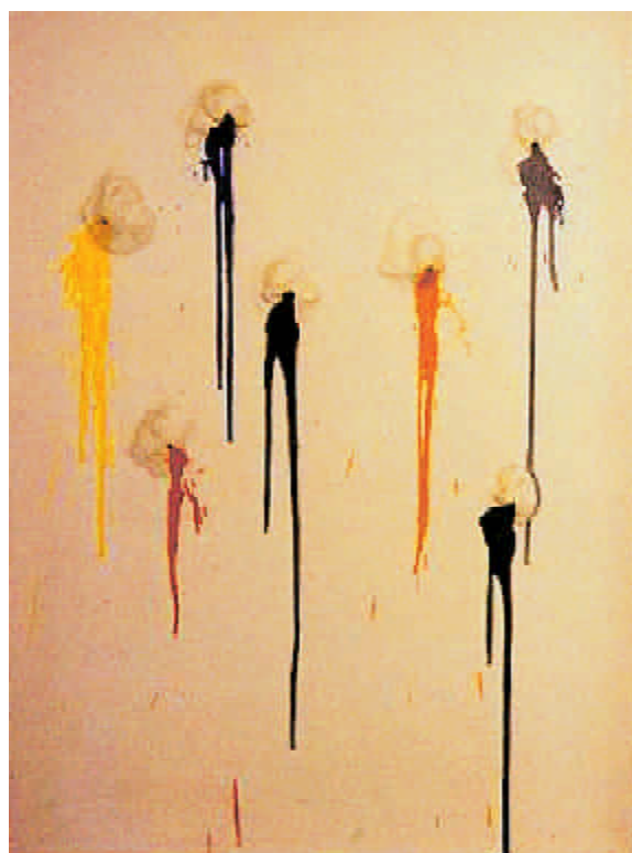
FIGURA1.- Pintura tiroteada. 1960

En una de las terrazas del Museo Olímpico de Lausanne, pueden contemplarse dos futbolistas de formas anatómicas exuberantes, en acción sobre una superficie de verde césped. Uno blanco y otro negro. Sus figuras son distintas, tanto por los vivos colores de sus uniformes deportivos, como por sus opuestas actitudes posturales. Uno de ellos en posición horizontal, defensiva, el otro de pie, atacando. Entre ambos una pelota blanca, con dibujo poliédrico rojo atípico. La obra, Futbolistas (acrílico sobre resina, 1993), es una pieza única, original de la artista Niki de Saint-Phalle . Este conjunto escultórico de temática deportiva, nos servirá de motivo para comentar diferentes aspectos de la vida y de la variada producción artística de esta enigmática mujer y de su extraordinaria actividad.