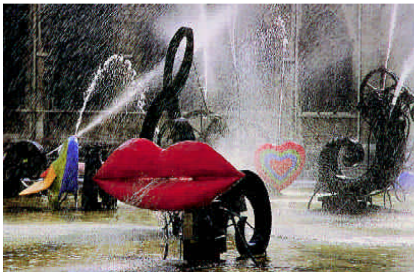
FIGURA.6.- Fuente de Stravinsky 1982

En 1965 aparecen las Nanas , nacidas de un dibujo académico de Larry Rivers representando a su mujer encinta. Son imágenes de mujer de cuerpo generoso, grueso, voluptuoso con redondeces ondulantes, pintadas a mano con colores vivos y brillantes. Confeccionadas al principio con lana y papel mâche y posteriormente con resina de poliéster e incluso con