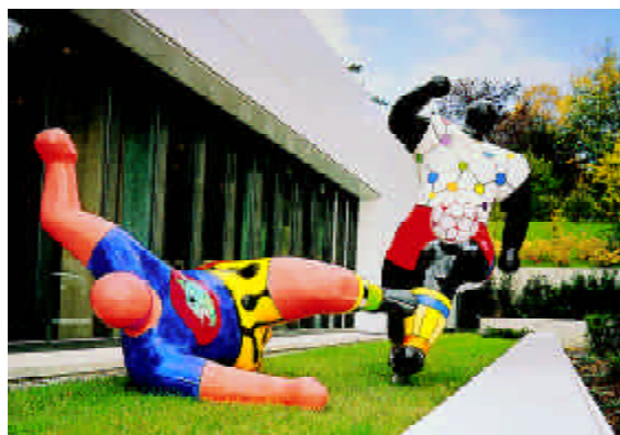
FIGURA.2.- Futbolistas. 1993