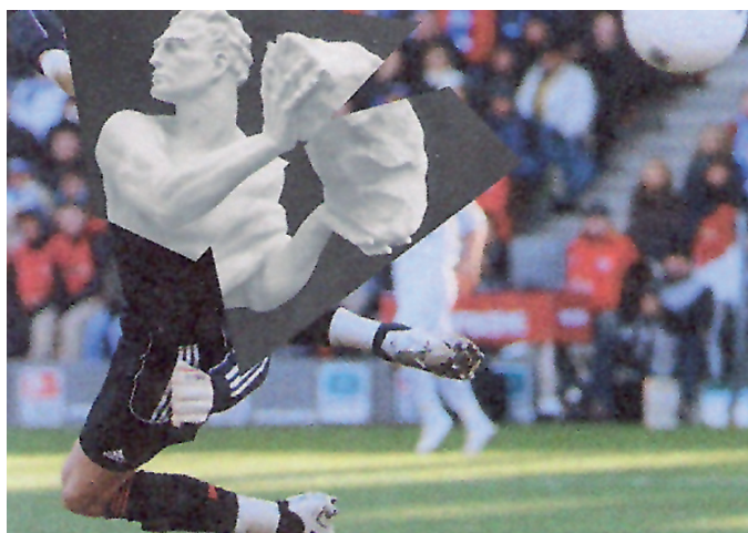
Figura 1. Jens Ullrich, nº 06, 113 x 127,8 cm.

que sobreponían imágenes fotográficas de fragmentos de esculturas deportivas neoclásicas con fracciones de fotografías coloreadas de deportistas contemporáneos en acción. Las imágenes se presentan a gran escala (1 x 1,5 m aproximadamente). Hemos tenido el placer de contemplar alrededor de treinta collages de la extensa bibliografía publicada y cabe remarcar que existe una paridad en la representación de mujeres y hombres.