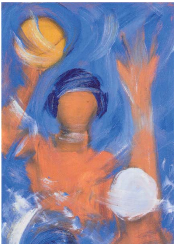
FIGURA 4. Waterpolista