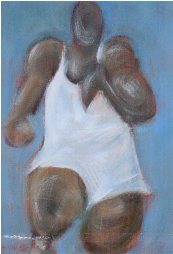
FIGURA 3. Lanzador