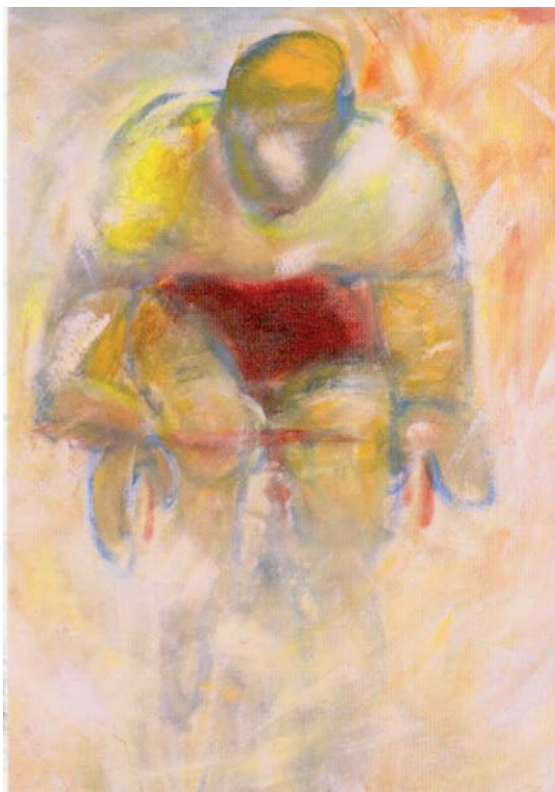
FIGURA 2. Ciclista