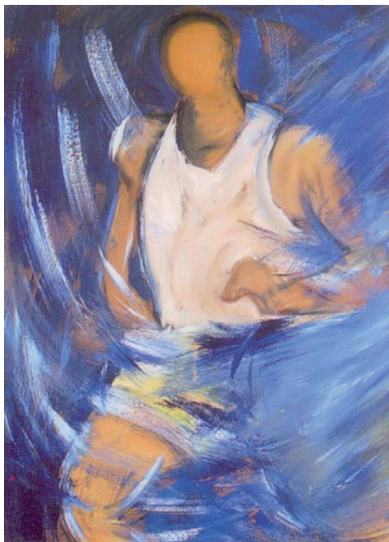
FIGURA 1. Corredor