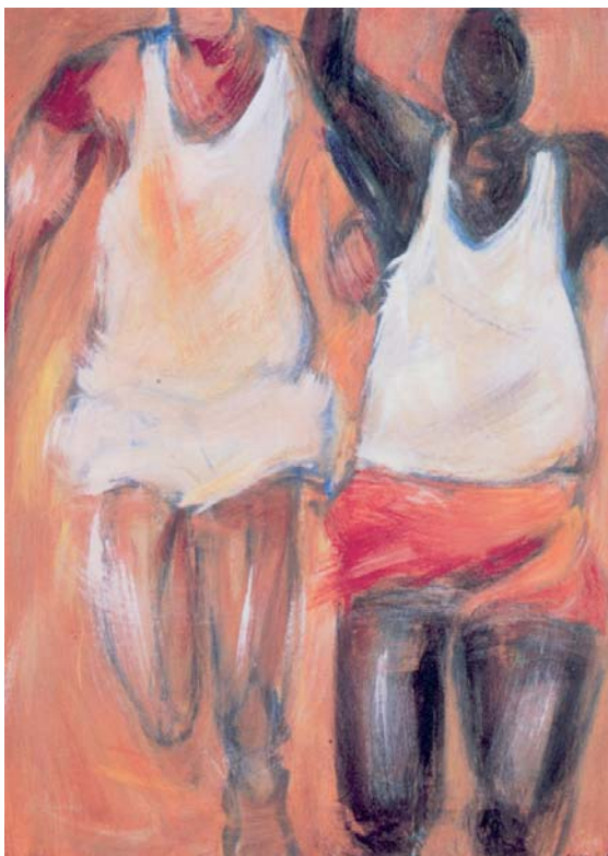
FIGURA 6. Llegada

La obra de Kyriacos Lizarides es original, peculiar y muy personal.